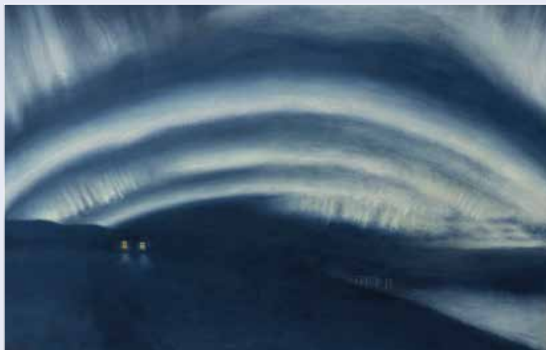
Island, 1. september, 1899

Den Hirschsprungske Samling har modtaget 14 værker af kunstneren Harald Moltke fra Danmarks Meteorologiske Institut. Værkerne viser Nordlys på Island i 1899.