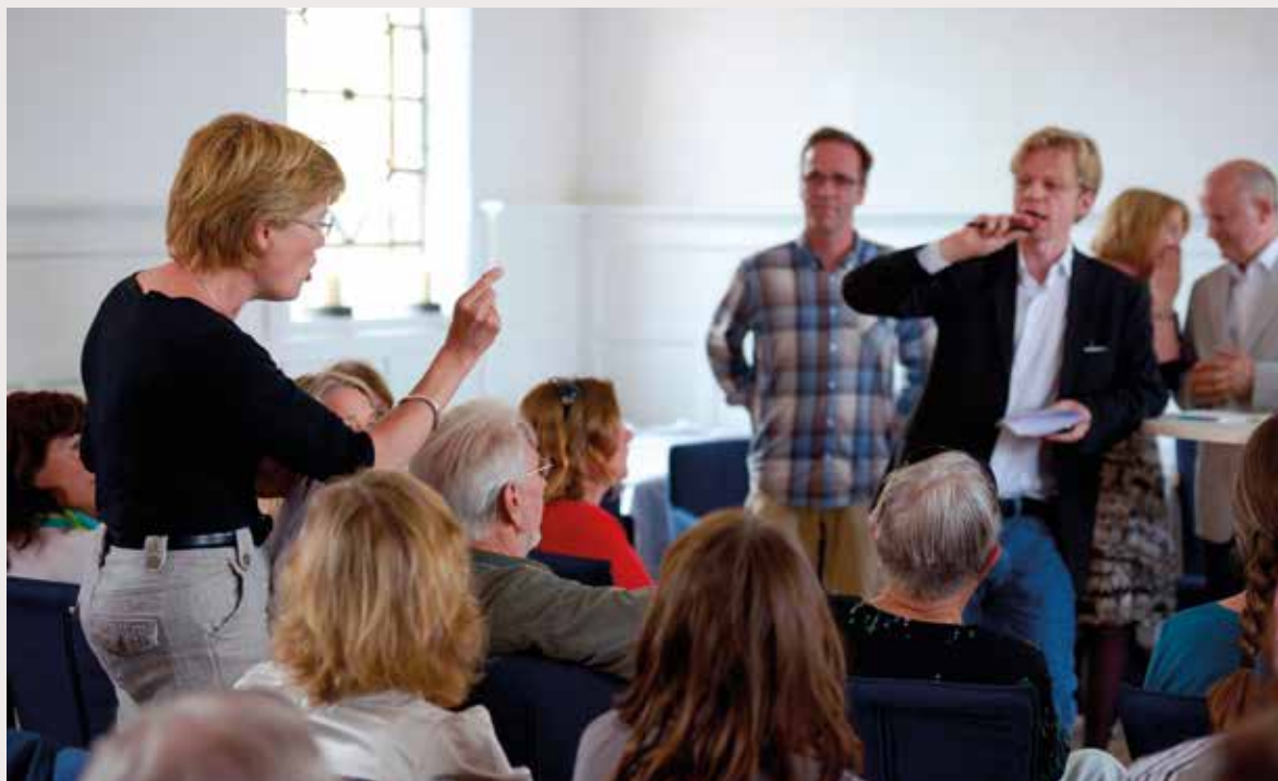
De nordiske folkemøder, her på Bornholm i debat om New Nordic School, er modeller for udvikling af den demokratiske samtale, som involverer og engagerer i stort omfang.

lovgivning og beslutninger, der har flyttet det nordiske samarbejde, men rekommandationer, anbefalinger, som er blevet til pasunion, ny nordisk mad og meget andet, der har skabt forandring og udvikling. Jeg tror godt, at et borgerting kan blive vældig engageret i at arbejde med forslag og se dem blive seriøst behandlet, vurderet og kommenteret i et mere formelt nordisk regi.