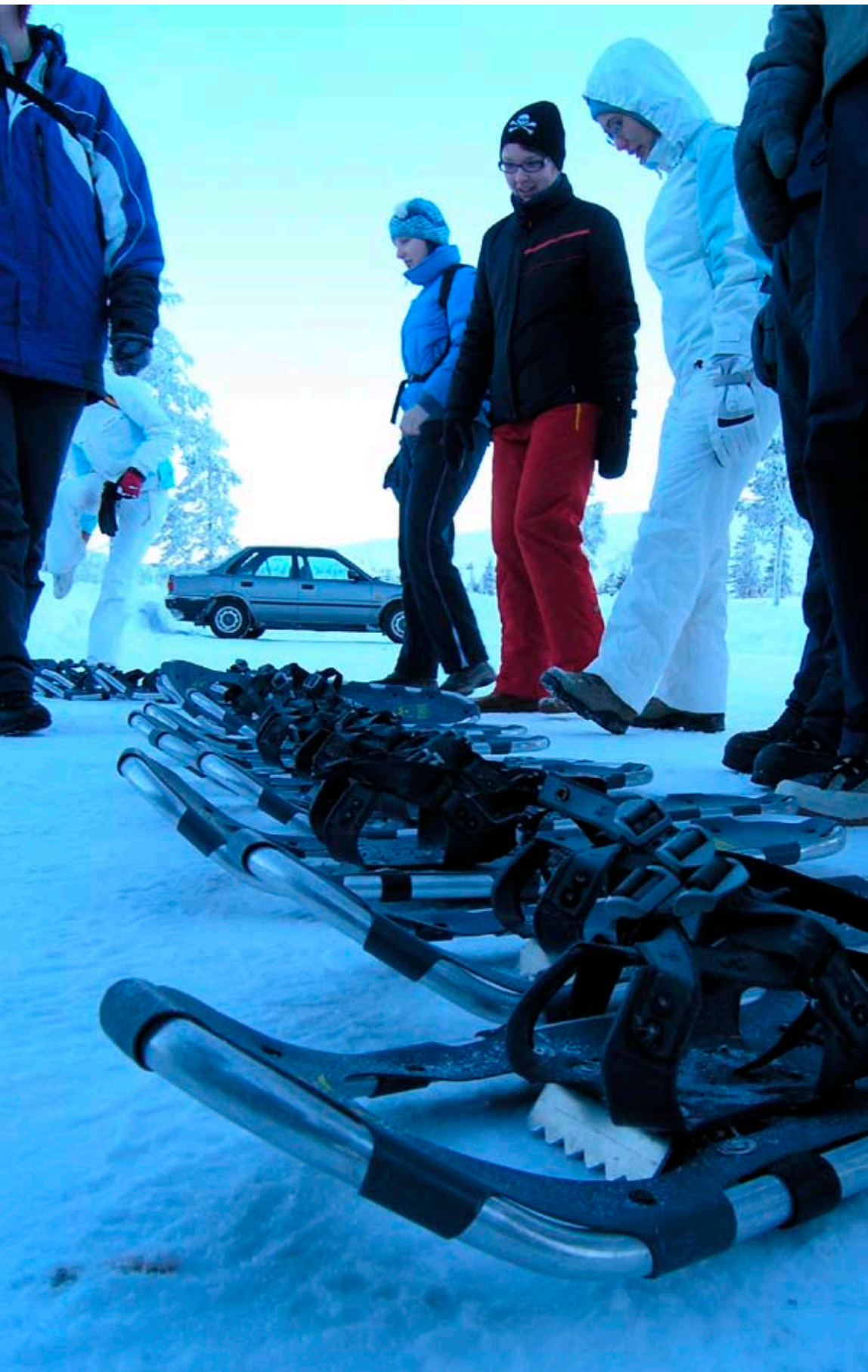
Saunaexpressen 2006, Finland

FNU er ved at planlægge rejserne for 2007, men har du gode idéer, er det stadig muligt at arrangere noget i det kommende år. Som det ser ud nu, arbejder vi med følgende ture: