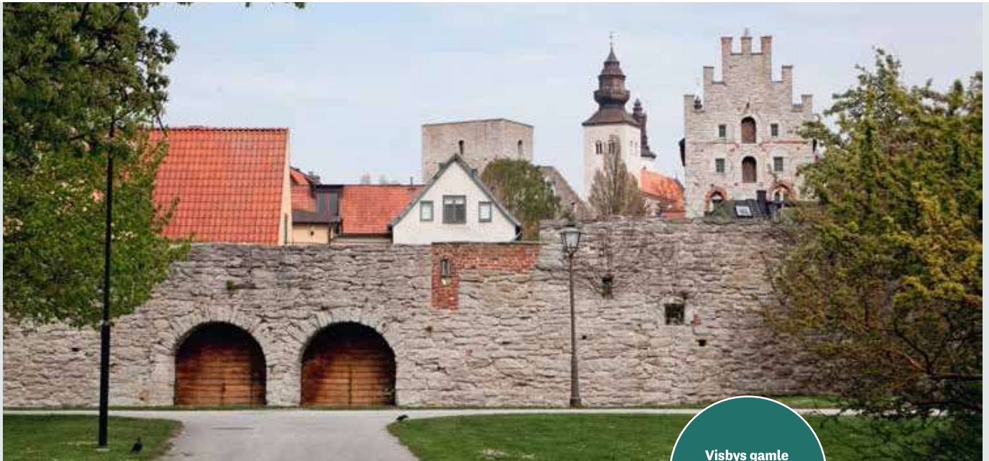
Visbys gamle murværk.